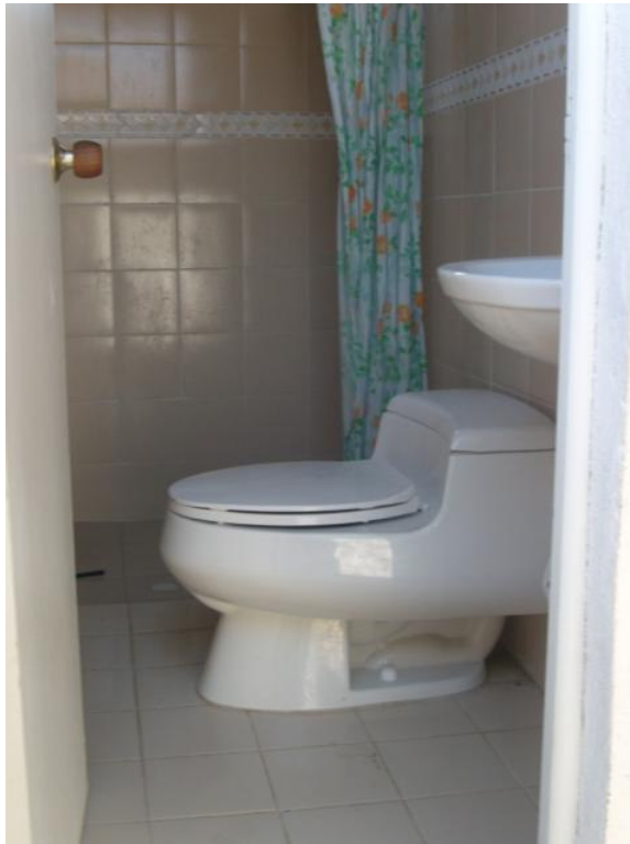
FAMILIA CAICEDO CHAVERRA